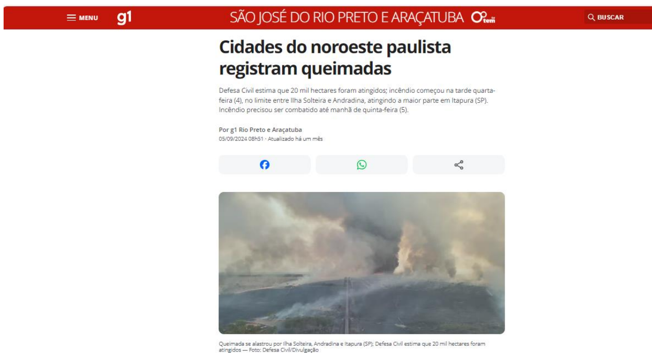
Figura 1 – Reportagem de Internet