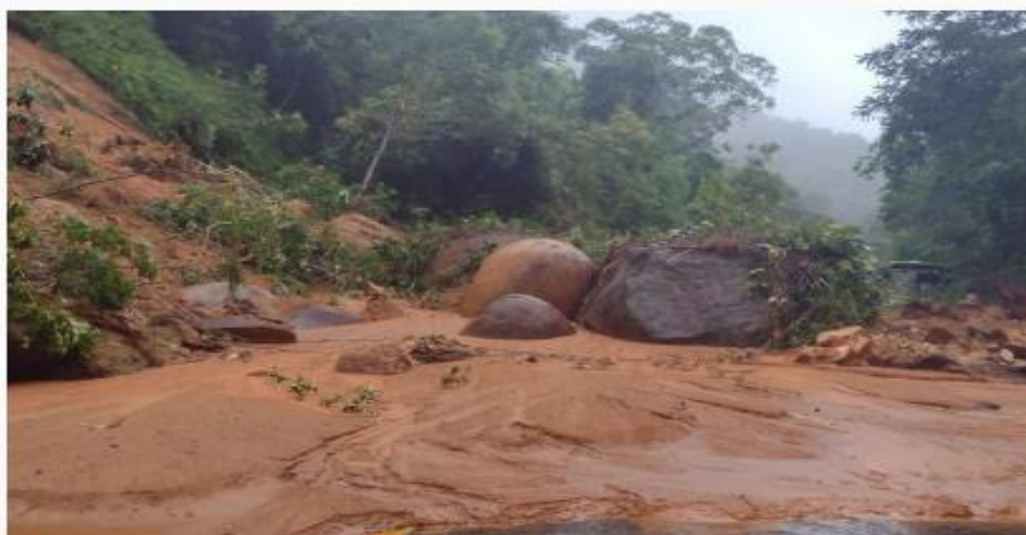
Deslizamento de terra interditou a Rodovia Rio-Santos, em Ubatuba

Pelo menos 60 pessoas ficaram desalojadas em Ubatuba, após as fortes chuvas que atingiram a cidade neste fim de semana. De acordo com a Defesa Civil, foram registrados 585 milímetros de chuva nas últimas 72 horas, causando deslizamentos e alagamentos em diversas regiões do município.